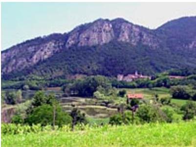
Provaglio d'Iseo, torbiere.

Subito dopo il passaggio a livello di Provaglio d'Iseo prendere a sinistra via Inquine che in mezz'ora ci porterà alla frazione Borgonato di Corte Franca.