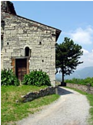
Provaglio d'Iseo, San Pietro in Lamosa.

Dopo aver superato il brolo, limitato dalla muraglia che circonda il castello di Passirano, seguire la pista ciclabile in salita sino alla curva a destra. Qui proseguire dritti verso il monte su strada sterrata. Al termine del rettilineo prendere a sinistra dopo le case e, giunti al campo sportivo del paese successivo prendere a destra la strada asfaltata in leggera salita. Giunti al monumentale ingresso di un palazzo settecentesco con scalinata scenografica prendere a sinistra per il paese sino al castello, ove i proprietari consentono la visita dello stesso (ingresso a pagamento nei giorni festivi www.castellieville.it ). All'uscita del castello a destra una strada prima acciottolata e poi asfaltata ci porta rapidamente ai ruderi della Pieve.