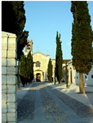
Rodengo Saiano, monastero.