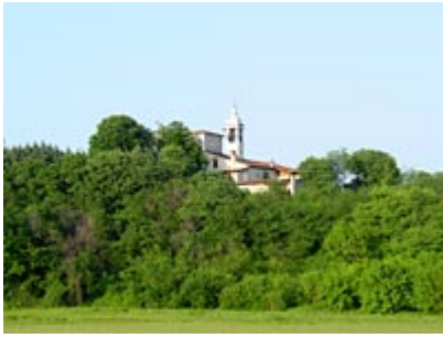
Sale, frazione di Gussago.