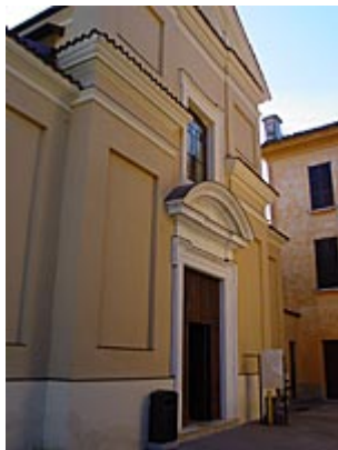
Rodengo Saiano, centro San Salvatore.