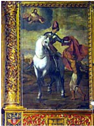
Borgo San Giacomo.

Il percorso inizia dalla centrale piazza Mazzini, sede di un antico mercato, realizzata nei pressi del castello. Si percorre via Marconi, proprio di fianco al Municipio di Pontevico, sino al termine del paese dove imbocchiamo la Provinciale N° 64 che seguiamo, oltrepassando il bivio per Verolavecchia sino allo stop sulla strada Quinzano Monticelli dove prendiamo a sinistra per un centinaio di metri e poi dritti per la stradina di campagna. Siamo finalmente usciti da strade più o meno trafficate e possiamo pedalare con tranquillità, per qualche decina di chilometri, sino al termine del percorso, poco oltre Bonpensiero di Villachiara.