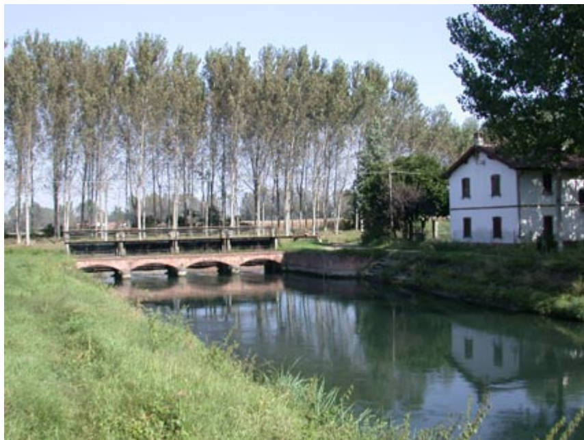
Il canale Pietro Vacchelli alla periferia di Salvirola si divide in due rami

Insedimenti antichissimi, sono stati intensamente abitati fino a pochi decenni orsono; riuniti nel 1862 a formare il comune di Triburgo, sei anni dopo furono aggregati a quello di Salvirola cremonese. La più distante ma anche la più interessante è Albera, con la sua splendida villa padronale cinquecentesca di stile palladiano recentemente restaurata. Notevoli anche il cascinale con quattro corti, che conserva un portale in stucco dipinto alla maniera austriaca settecentesca, la chiesetta e il campanile.