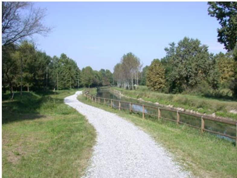
sulla ciclabile per Ariadello

Da Tombe Morte passa la recentissima pista ciclabile denominata "delle città murate"; realizzata dalla Provincia di Cremona, essa consente il collegamento con Genivolta (a nord), lungo il moderno canale scolmatore.