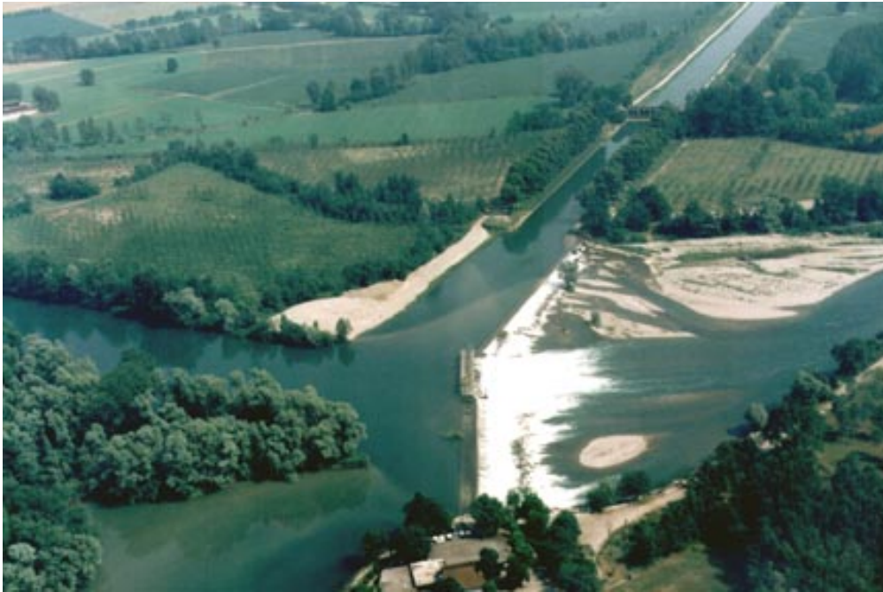
vista aerea del fiume Adda nella zona della derivazione del canale Vacchelli

Il canale Pietro Vacchelli inizia sulla sponda sinistra dell'Adda, in territorio di Marzano (Comune di Merlino, provincia di Lodi). La località diede il primo nome al canale, poi intitolato al fondatore del Consorzio; ancora oggi, comunque, è frequentemente chiamato "canale Marzano".