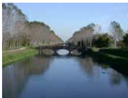
ponete del Lagazzone

Procedendo oltre, all'ombra di bei filari di pioppi, si incontra, poco dopo, il secondo ponte in cotto, collegante le cascine Resega e Reseghina. Si noterà la maldestra riparazione delle spallette con malta di cemento. E' stato l'ultimo e più recente tentativo per cercare di arrestare la graduale demolizione del manufatto operata dai soliti ignoti che asportavano mattone su mattone. L'effetto estetico è certo disdicevole ma, per ora, la demolizione si è arrestata.