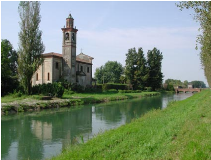
Il canale Pietro Vacchelli nella zona dei Mosi di Bagnolo affianca la Chiesetta degli Alpini

Ritornati sulla sterrata in sponda sinistra, incrociamo dopo poche centinaia di metri il grande ponte canale, affiancato da ponti stradali, a servizio della roggia Alchina, il cui nome è dovuto agli omonimi fratelli suoi proprietari sul finire del Trecento. Altro importantissimo corso d'acqua, nasce da fontanili nel basso Bergamasco e, dopo avere affiancato l'Acquarossa fino ad Ombriano, va ad irrigare il territorio dei comuni a sud di Crema.