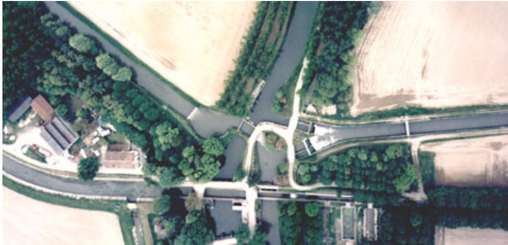
vista aerea di tomba morta

Il Vacchelli ora corre pensile rispetto alla campagna latitante; dopo un'ampia curva verso sinistra esso giunge ormai al termine del suo tragitto, in località Tombe Morte di Genivolta, dove alimenta un sub-dispensatore del Consorzio irrigazioni ed impingua: il Naviglio Grande Pallavicino (del Consorzio medesimo), lo stesso Naviglio Civico e le innumerevoli rogge provenienti da monte, che qui si incrociano tramite notevoli manufatti d'ingegneria idraulica che provocano giochi d'acqua d'ogni tipo. E' questo un nodo idraulico molto importante, ma anche un angolo di notevole interesse naturalistico, dove in estate più o meno giovani bagnanti e pescatori si danno appuntamento per divertirsi o per riposare in mezzo al verde e alla tranquillità.