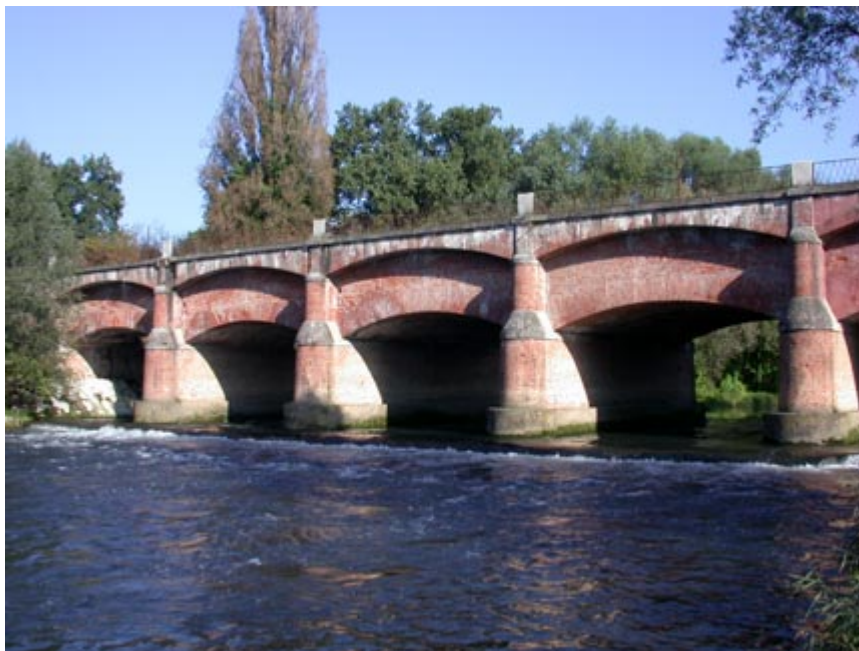
Il ponte-canale del Vacchelli sul fiume Serio a Crema

A valle del ponte n. 30 conviene passare in destra, percorrere il tratto di pista ciclabile esistente, indi proseguire lungo via Gaeta, al termine della quale incrociamo la strada statale 591 "Cremasca", che il canale Vacchelli sottopassa in sifone.