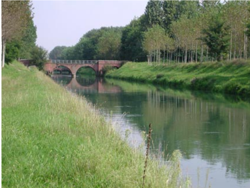
Il canale Pietro Vacchelli in territorio di Izano

Prima di proseguire si consiglia di percorrere un centinaio di metri lungo la via Brescia verso Offanengo per visitare l'oratorio della Pietà, eretto nel 1760 sulle rovine di una chiesetta agreste risalente al 1611. Riprendiamo ora la carrareccia sulla sponda sinistra del Vacchelli; dopo circa 700 metri oltrepassiamo il ponte della statale "di Orzinuovi" e, dopo altrettanti, incrociamo il Serio morto. Questo corso d'acqua, di origine antichissima, nasce da sorgive in territorio di Camisano e scorre in direzione sud fino a sfociare nell'Adda a Pizzighettone; il suo nome deriva dal fatto di essere stato per moltissimo tempo, a valle di Madignano, il tratto terminale del corso del Serio, prima del suo naturale spostamento verso Montodine. Dal ponte-strada sul Vacchelli ubicato appena a monte del ponte-canale di cui sopra possiamo fare una deviazione e seguire verso sud la strada fiancheggiante il Serio morto, fino a raggiungere la frazione di Vergonzana, con la settecentesca chiesa di S. Rocco, ricca di opere d'arte, e le sue ville patrizie, tra le quali spicca la seicentesca Villa Zurla, sorta su un precedente castello di cui rimangono una torre e parte della cinta muraria con l'ampio giardino.