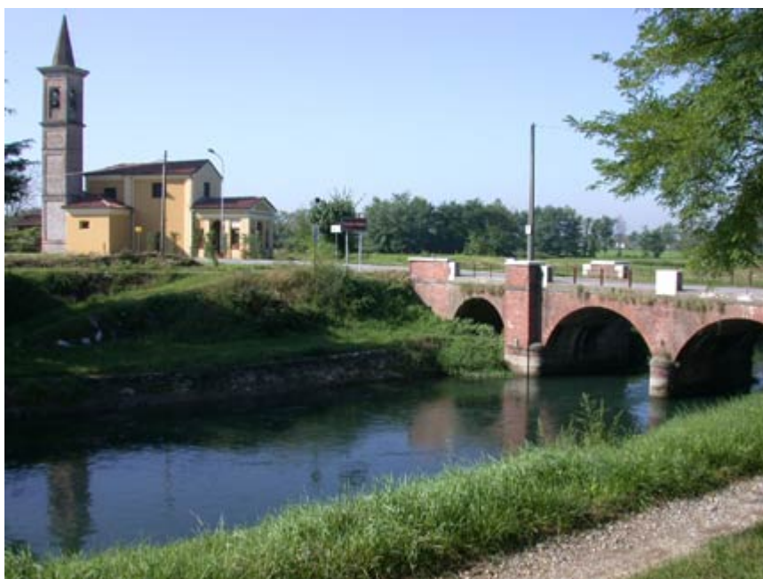
Il canale Pietro Vacchelli a Palazzo Pignano costeggia la chiesetta della Madonna delle Asse

Ritornando al Vacchelli, poco dopo il ponte da cui ci siamo staccati incontriamo altri due sottopassi, a servizio rispettivamente delle rogge Migliavacca e Benzona, derivazioni del Tormo. Indi proseguiamo dritti, finché una dolce curva verso destra ci porta al ponte della strada Monte-Palazzo, dove ci accoglie il piccolo santuario della Madonna delle Asse, dove è consigliabile fare una breve visita e godere della sua quiete.