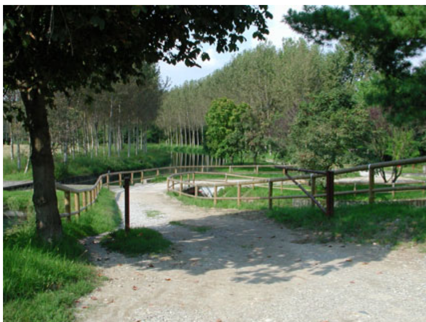
il percorso attraverso tomba morta

Ritornati per la stessa strada al canale Vacchelli, riprendiamo il percorso in uno scenario per lungo tratto caratterizzato da quiete e silenzio tra filari di pioppi. Arrivati in corrispondenza della cascina Colombara Nuova, si incontra un segno di vita: uno spazio in sponda destra attrezzato con panche, tavoli e tettoie, luogo di ritrovo dei pensionati di Trigolo; poi, superata la cascina ' Colombara del bosco ', lasciata sulla destra la cascina Gallotte e sovrappassato il cavo Geronda, impinguato dal nostro Canale, si arriva al ponte della provinciale Trigolo-Cumignano, a lato della quale troviamo la cascina Castelletto Barbò, altra notevole testimonianza di architettura rurale, lambita dal Naviglio Civico, che per il prossimo chilometro ci troveremo sempre quasi parallelamente a poca distanza sulla sinistra.