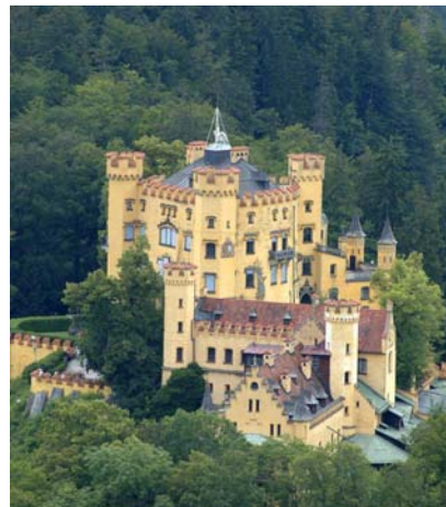
Castello di Hohenschwangau