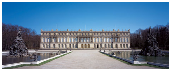
Castello di Herrenchiemsee