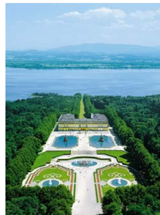
Giardini del Castello di Herrenchiemsee