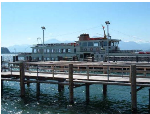
Traghetto da Chiemsee