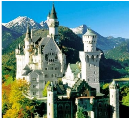
Castello di Neuschwanstein